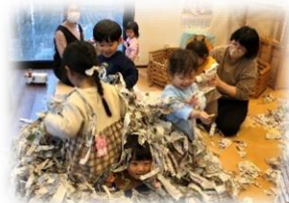
みんなで新聞あそび