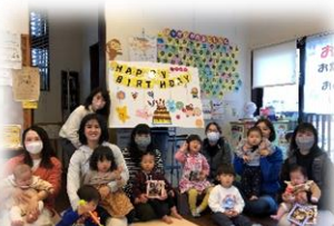
「誕生会」お誕生日のお友だちをお祝いしましょ!