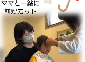
ママと一緒に前髪カット